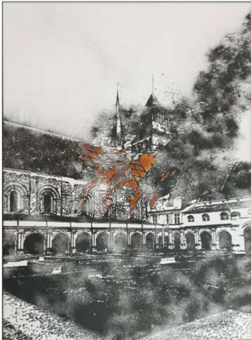
Nicolas Daubanes, La mutinerie de Fontevraud : l'incendie de l'abbatiale , 2023

Les parcours doivent avoir une PROBLEMATIQUE .