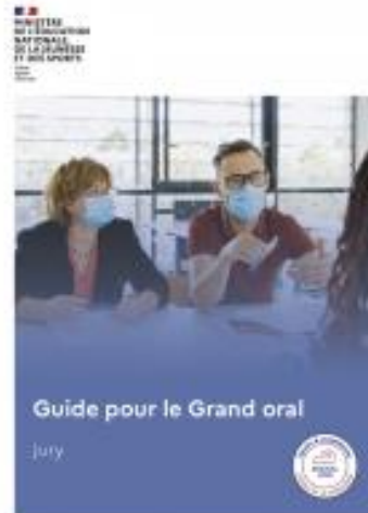
Guide pour le jury de l'épreuve de Grand oral