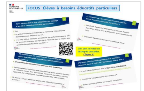
FOCUS Éléves à besoins éducatifs particuliers*

* Ressources académiques accessibles aux enseignants de Versailles