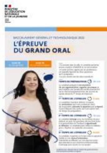
Cette affiche présente aux élèves le déroulé de l'épreuve du Grand oral.