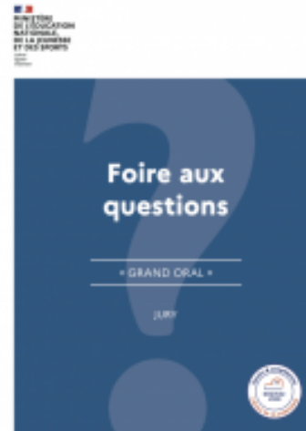
Questions/réponses pour le jury du Grand oral (document mis à jour en avril 2022).