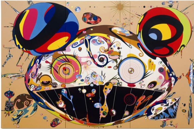
Takashi Murakami, Tan Tan Bo , 2001, acrylique sur toile, 360 x 540 cm. Tomio Koyama Gallery, Tokyo.

L'épreuve orale dite Grand oral de la classe de terminale de la voie générale à compter de la session 2022, invite à penser la manière dont chacun de nous peut accompagner les élèves dans la construction d'une prise de parole en public, ancrée, claire, potentiellement convaincante. Publié dans la note de service du 27-7-2021 ( Bulletin officiel n°31 du 26 août 2021 ), le contenu et l'organisation de cette épreuve obligatoire précisent les enjeux de sa mise en place en voie générale et technologique à la fin de l'année de Terminale.