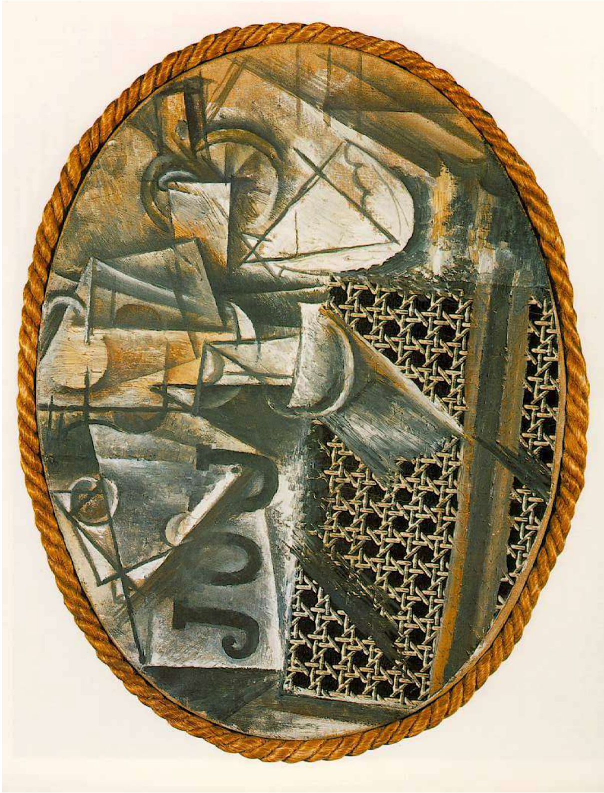
Pablo PICASSO (1881-1973), Nature morte à la chaise cannée , 1912, huile et toile cirée sur toile encadrée de corde, 29 x 37 cm. Musée national Picasso, Paris, France.