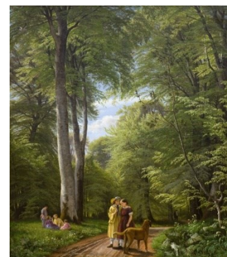
A Beech Wood in May near Iselingen Manor, Zealand, 1857 Skovgaard, P.C. CC0

Les métiers de la conservation, de l'archive, de la recherche se sont saisis des potentialités offertes par l'Intelligence Artificielle. La National Gallery of Denmark SMK lance une plateforme de diffusion et valorisation de sa collection en ligne SMK Open . Environ 40 000 œuvres sont numérisées et sont diffusées en open content , classées au moyen de l'intelligence artificielle.