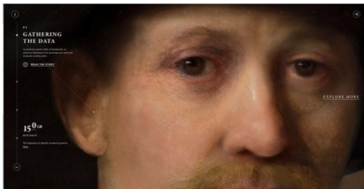
ING Group -The Next Rembrandt – Flickr CC BY 2.0

automatique des images en construisant son image, en marquant son intention notamment faisant référence à la peinture néoclassique et au genre de l'allégorie. Le faire comme devant permettre à ses yeux d'être élevés au même statut d'artiste que les peintres. Le projet The Next