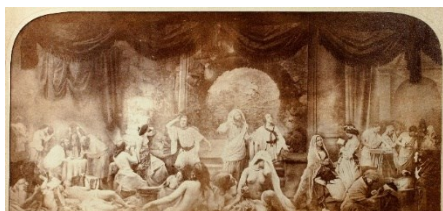
Two Ways of Life

L'artiste victorien Oscar Gustaf Rejlander est surtout resté dans l'histoire pour son œuvre photographique moralisatrice de 1857, Two Ways of Life [Les deux façons de vivre].