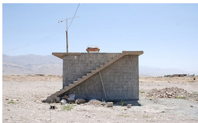
Hiwa K (né en 1975 en Irak) One room apartment

Contacts presse : Agnès Renault Communication 01 87 44 25 25