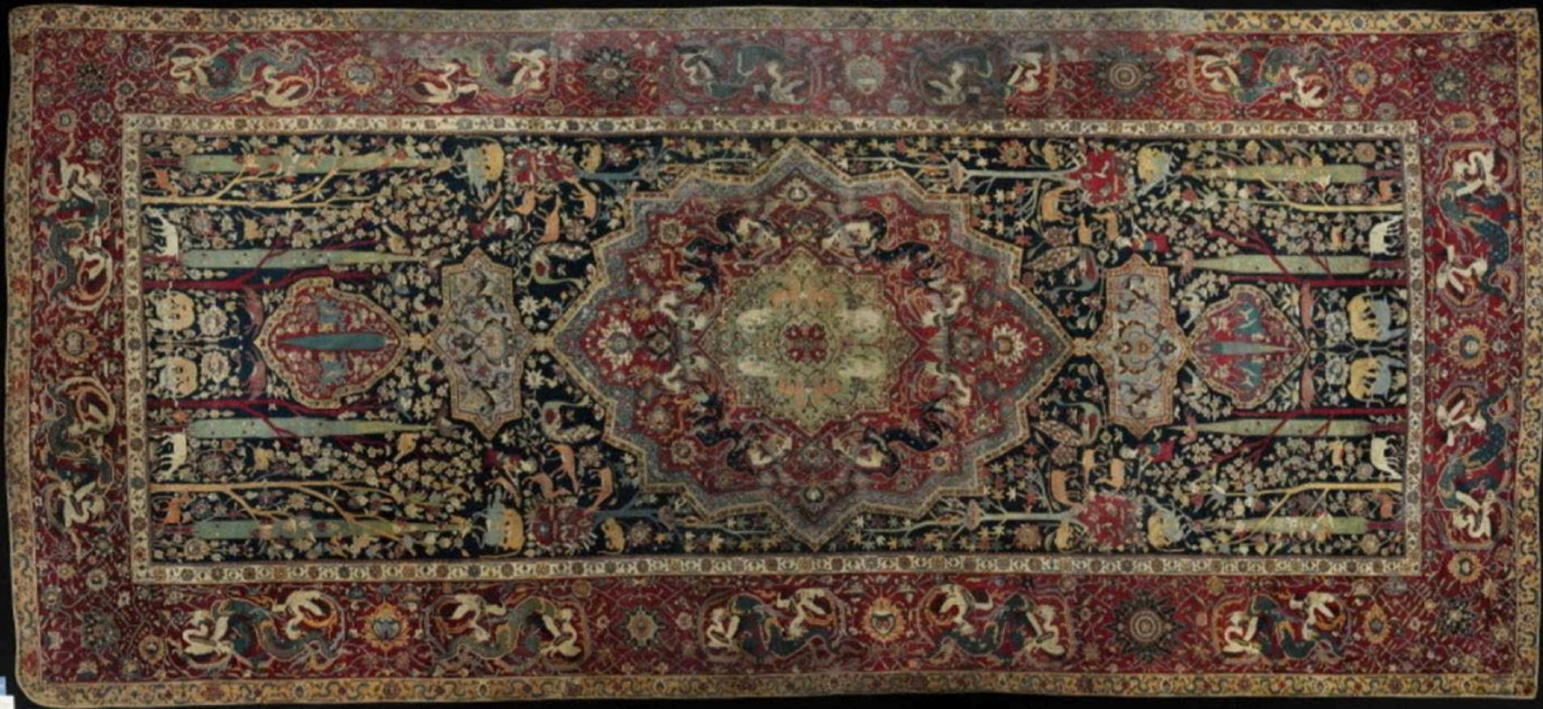
Tapis à décor jardin de Paradis, dit de Mantes, DAI, OA 6610, 390 x 780 x 0,5 cm. Provient de la Collégiale de Mantes.