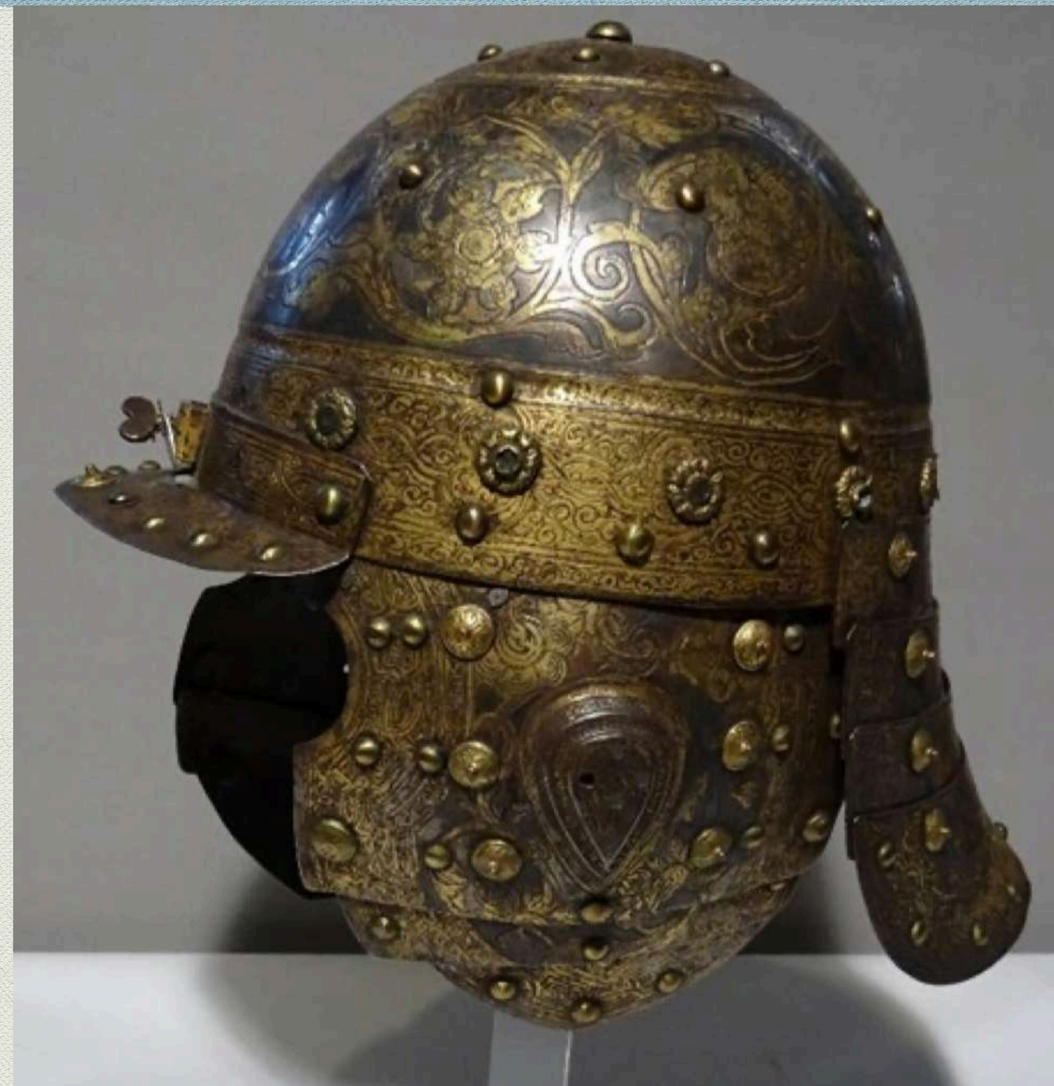
Casque « à la Turque », H 261 provenant de Vienne ; Augsbourg, Vers 1590

https://www.louvre.fr/en-ce-moment/vie-du-musee/arts-de-l-islam-un-passe-pour-un-present-18-expositions-dans-toute-la-france